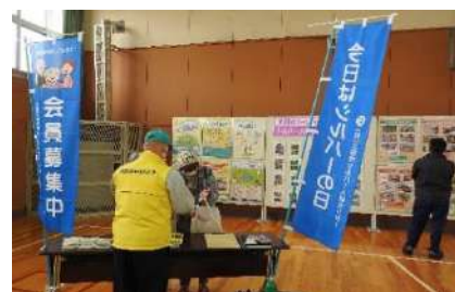
まなびとくらしのフェスティバル

マスク越しの声掛けに「シルバーさんね！またお願いしますね！」と皆様から温かく応えていただき、仕事の依頼もあるなど、今後も様々な機会でも募集活動に取り組みたいと考えています。