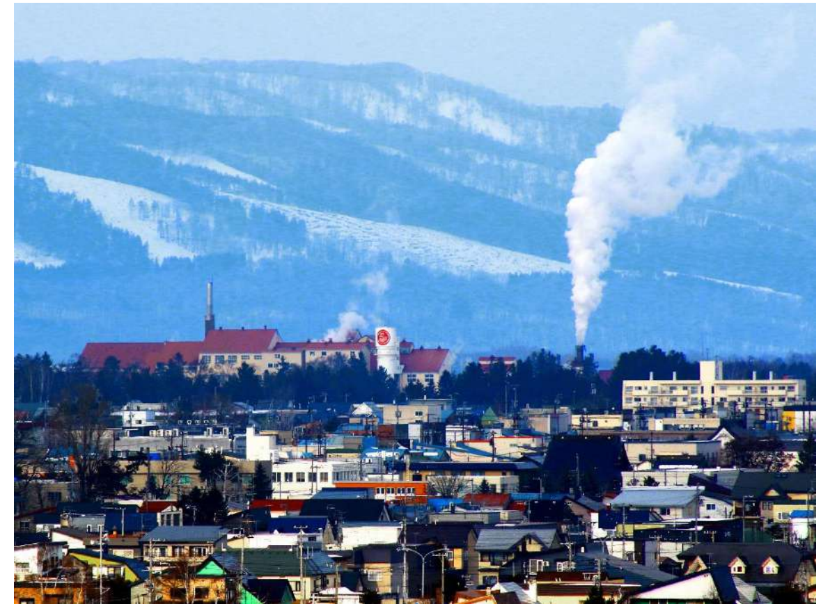
砂糖のまち 甘い香り漂う日甜士別工場